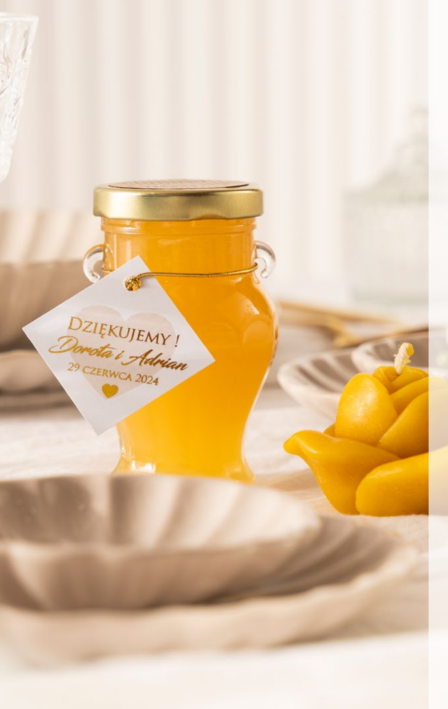
OFERTA EVENTOWA – MIODY