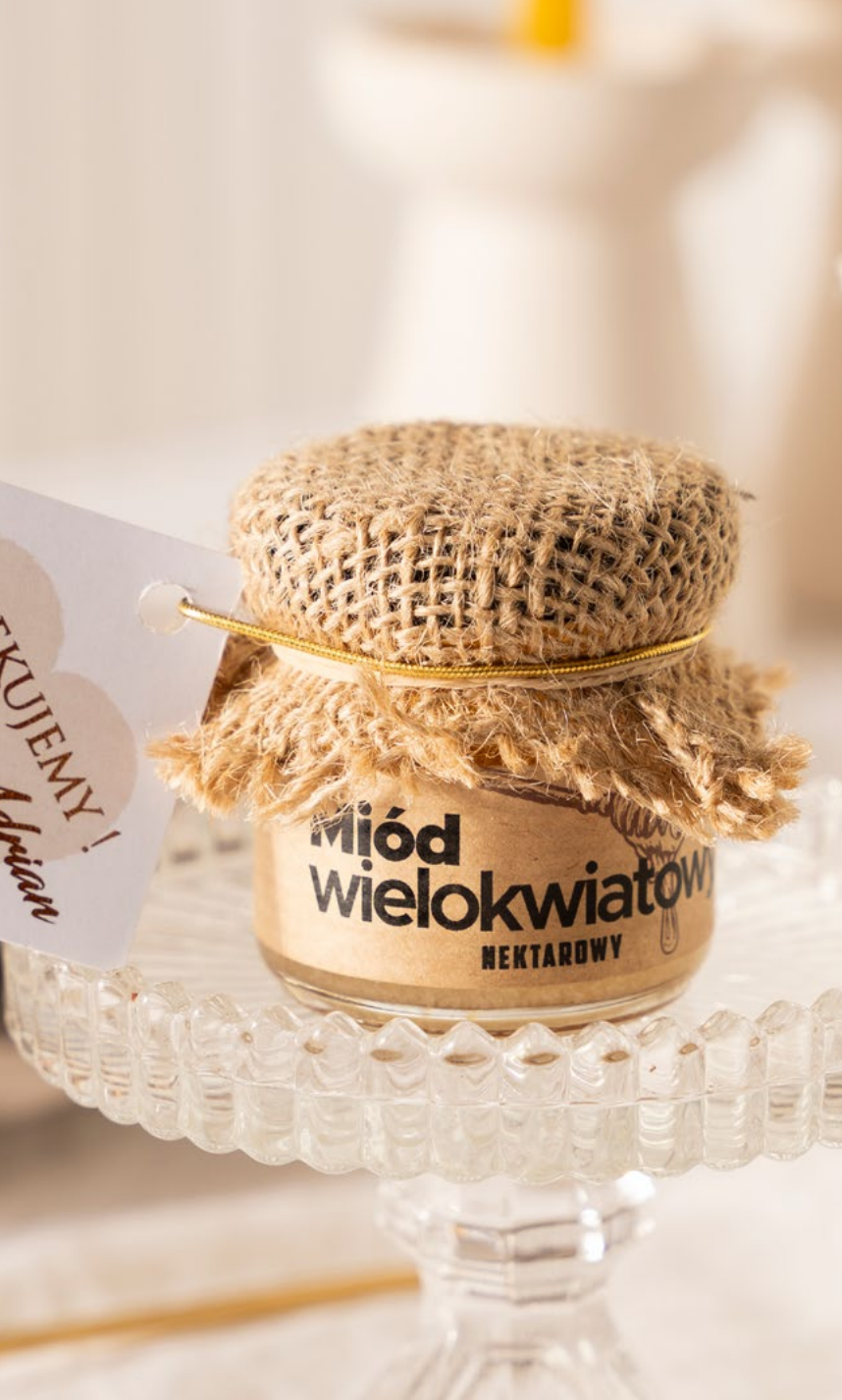
OFERTA EVENTOWA – MIODY