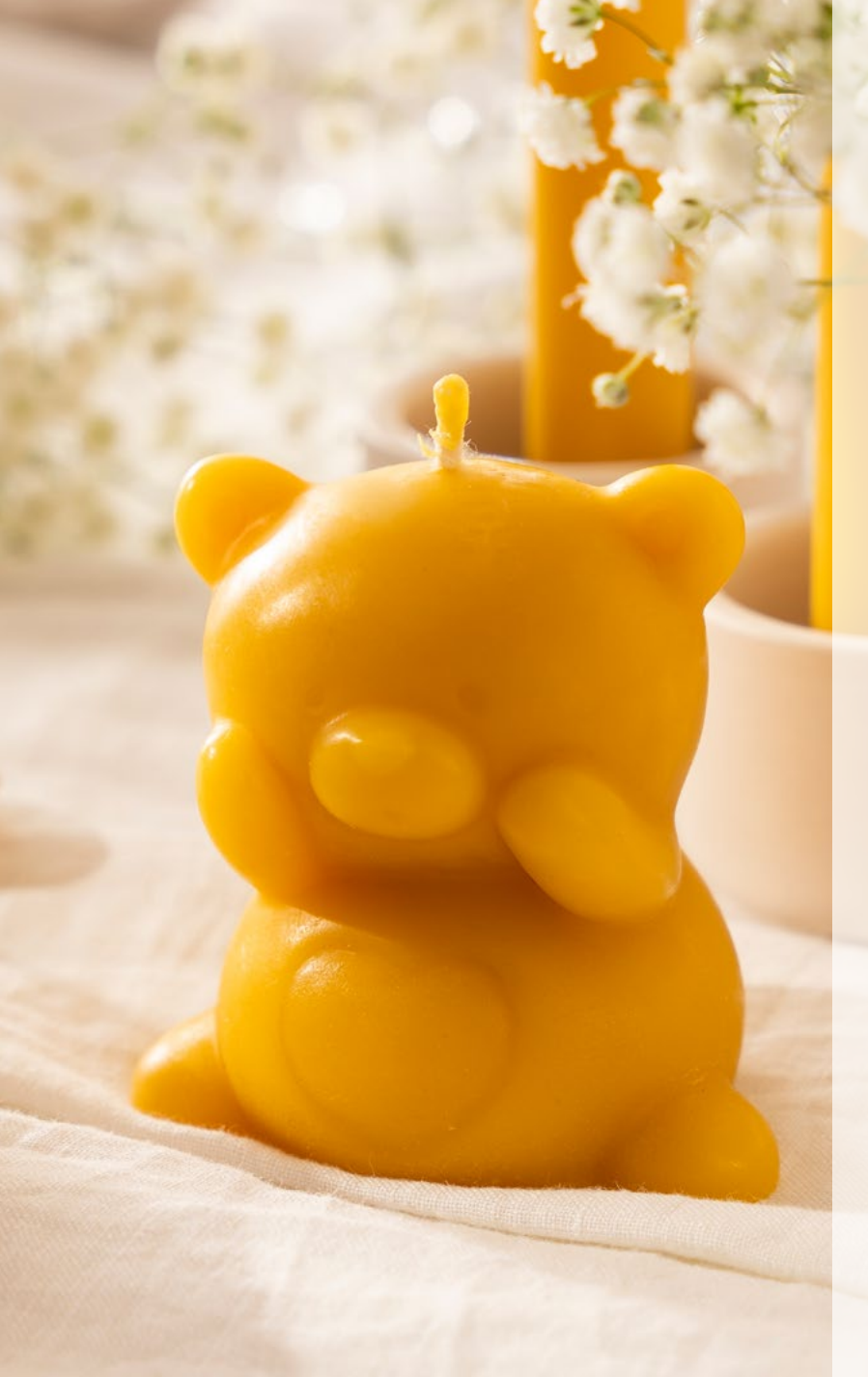
OFERTA EVENTOWA – ŚWIECE